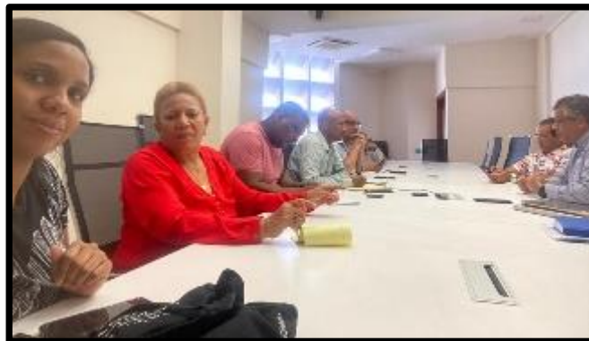
Imagen reunión ECOP Las Mercedes